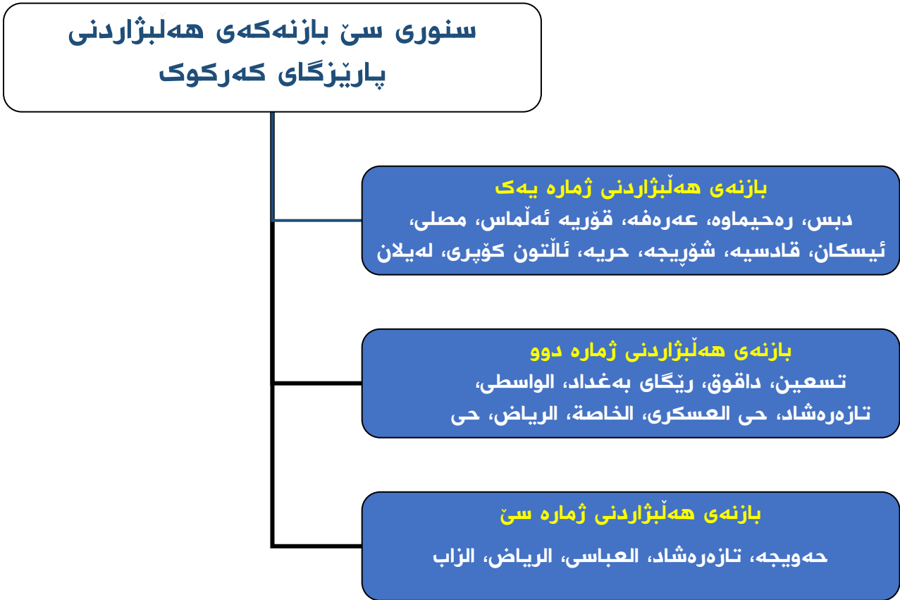
گرافىك ژمارە 2-